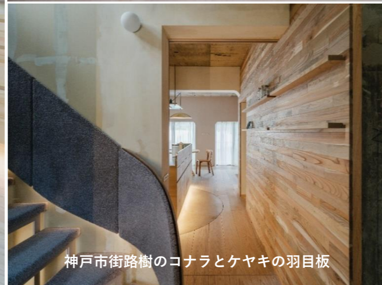
神戸市街路樹のコナラとケヤキの羽目板