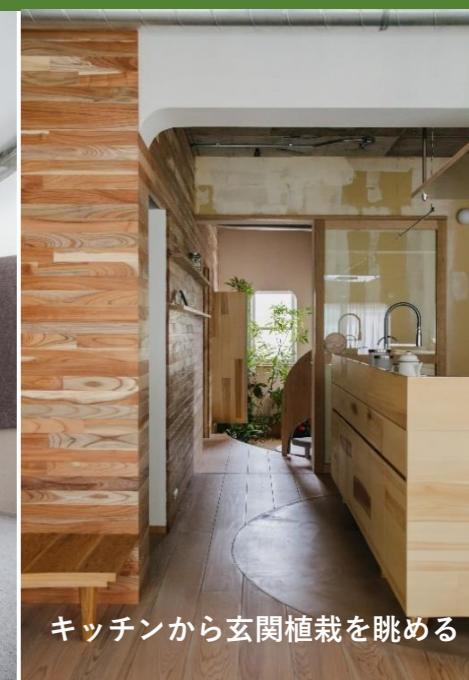
キッチンから玄関植栽を眺める

コンクリートのハコ中に柔らかな花が咲く。1階と2階を繋げ 2階にもリビング。2階のリビングと各個室を緩やかに繋げ 暮らす人の心の中に優しさの花を咲かせました。