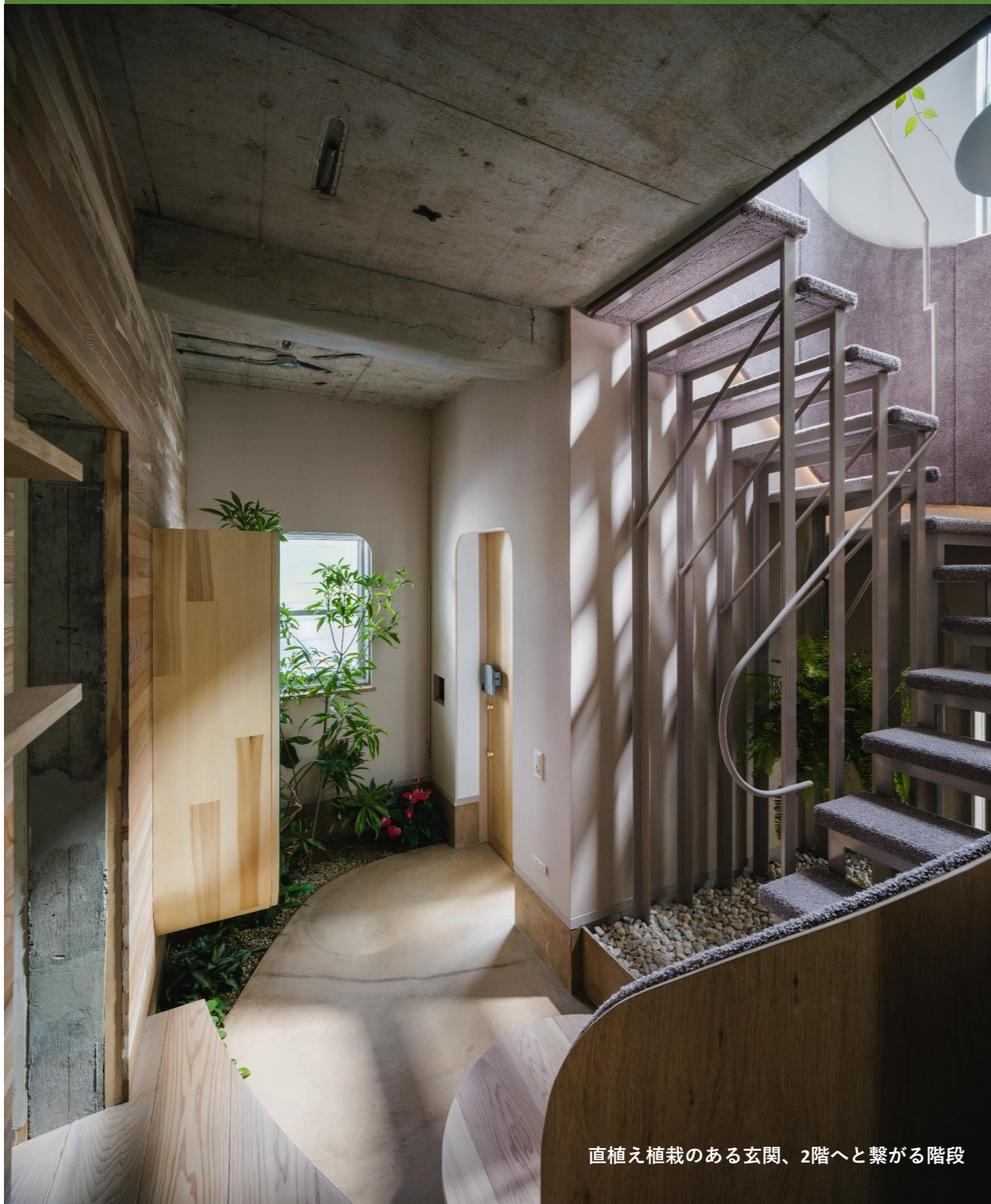
直植え植栽のある玄関、2階へと繋がる階段

築50年の中古マンションを購入して、「木のマンションリノベーションシープ」のコンセプトハウスを造ってみた。地域材(無垢材)普及と数多く存在する中古マンション活用のストック型社会構築の為に、最後は賃貸に出します!!