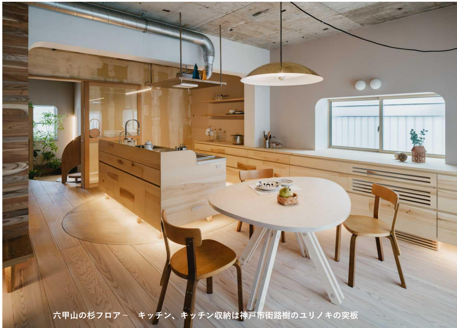
六甲山の杉フロアー キッチン、キッチン収納は神戸市街路樹のユリノキの突板