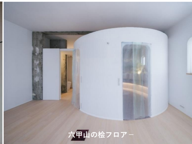
六甲山の桧フロアー