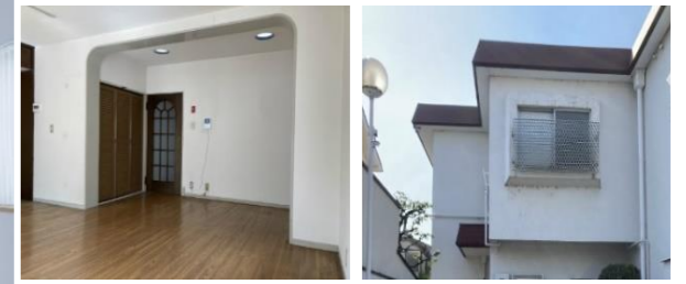
▼元々のマンションのイメージは全体的に丸であった為、元々のイメージを崩さず全体に丸みを生かした形状とした。