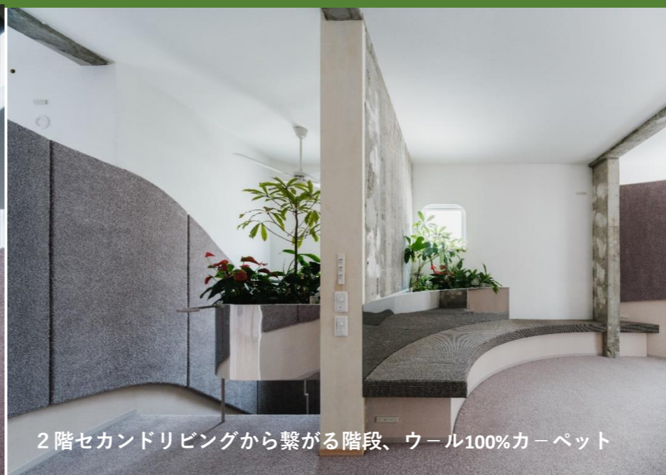
2階セカンドリビングから繋がる階段、ウール100%カーペット